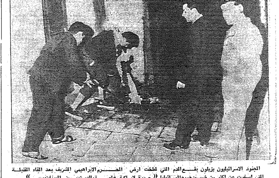
الجنود الإسرائيليون يزيلون بقية الدم التي تلطخت ارض الحرم الإبراهيمي الشريف بعد القاء القنبلة التي اسفرت عن أكثر من خمسين جرحاً إسرائيلياً

الخليل - خاص بالدستور - تحولت مدينة الخليل الى ما يشبه الكنيسة العسكرية اعتباراً من مساء الأربعاء الماضي . إلى تكدت على المدينة نجمات من قوات العدو ، اثر انفجار للمسم في الحرم الإبراهيمي . وقد تبركت القوات الإسرائيلية في